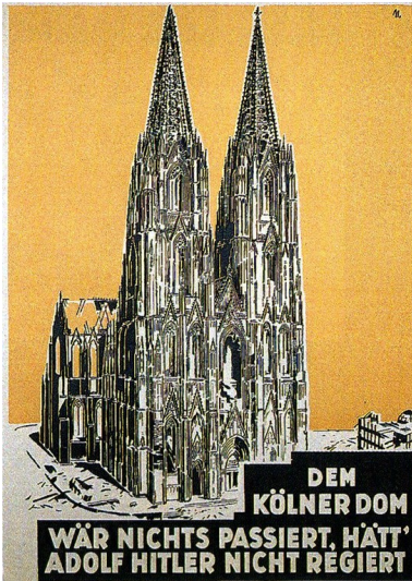
Zeichnung des im Zweiten Weltkrieg stark beschädigten Kölner Doms auf einem Plakat (um 1946), untertitelt ist die Abbildung mit 'Dem Kölner Dom war nichts passiert, hätte Adolf Hitler nicht regiert'.