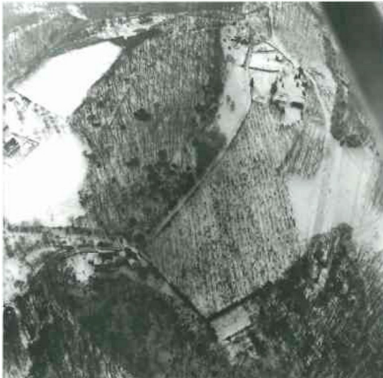
Ringwall Alteburg in Heidhausen