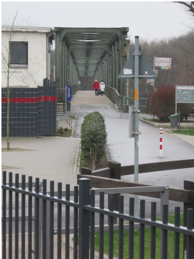
Essen-Kupferdreh, Ruhrtalbahn, Eisenbahnbrücke Heisingen - Kupferdreh (2016)