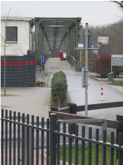
Essen-Kupferdreh, Ruhrtalbahn, Eisenbahnbrücke Heisingen - Kupferdreh (2016)