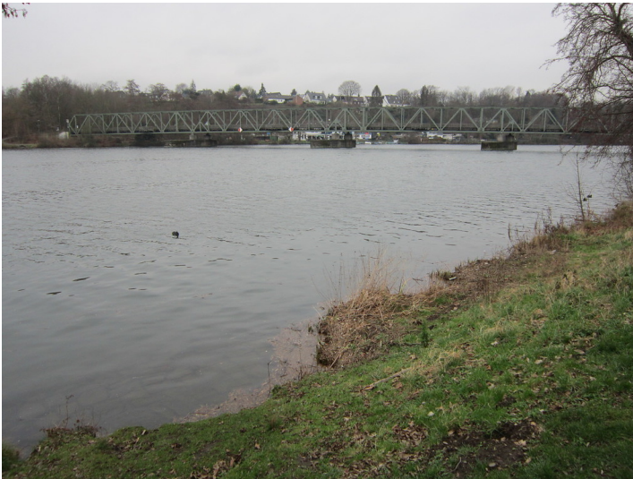
Essen-Kupferdreh, Ruhrtalbahn, Eisenbahnbrücke Heisingen - Kupferdreh (2016)