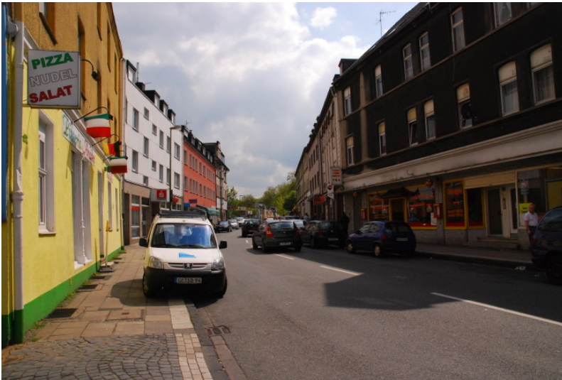
Historischer Ortskern Schonnebeck (2010)