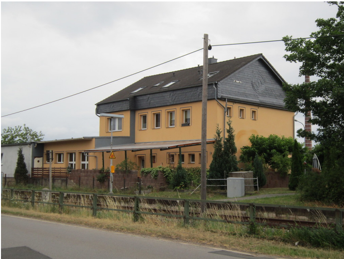
Bahnhof Stotzheim, Empfangsgebäude (2015)