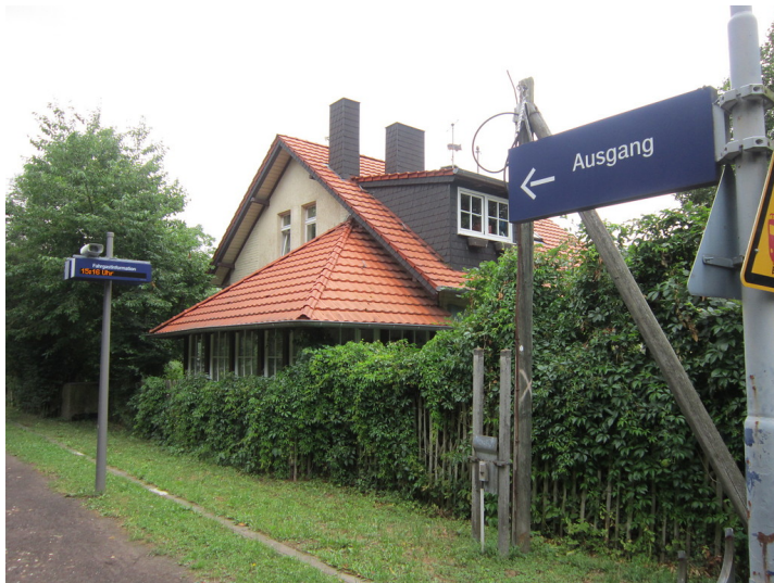
Euskirchen-Kreuzweingarten, Empfangsgebäude (2015)