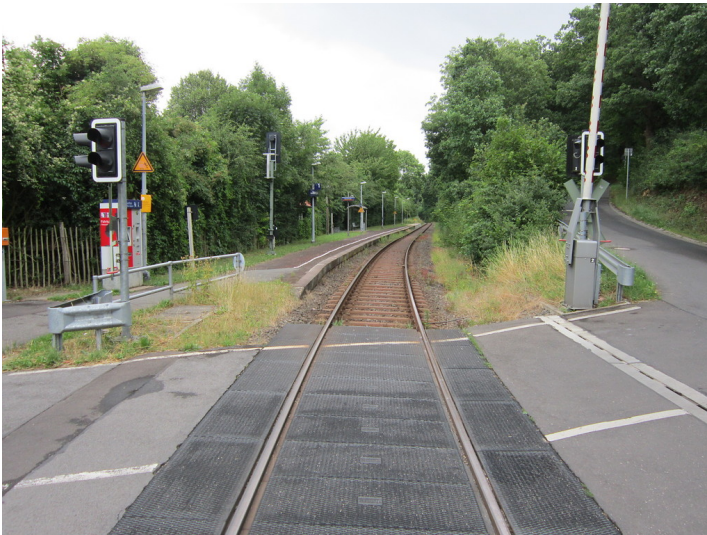
Euskirchen-Kreuzweingarten, Haltepunkt (2015)