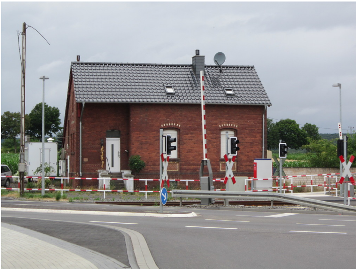
Bahnhof Arloff, Empfangsgebäude der EKB (2015)