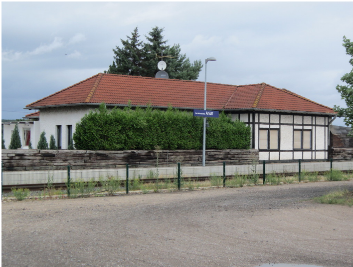
Bahnhof Arloff, Empfangsgebäude (2015)