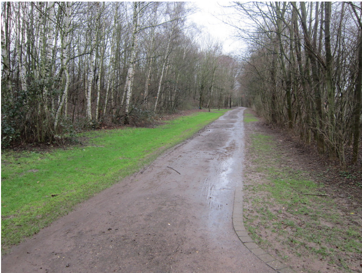
Ehemalige Bahntrasse von Meiderich nach Hohenbudberg, Duisburg-Trompet, Moerser Straße / Unterstraße (2015)