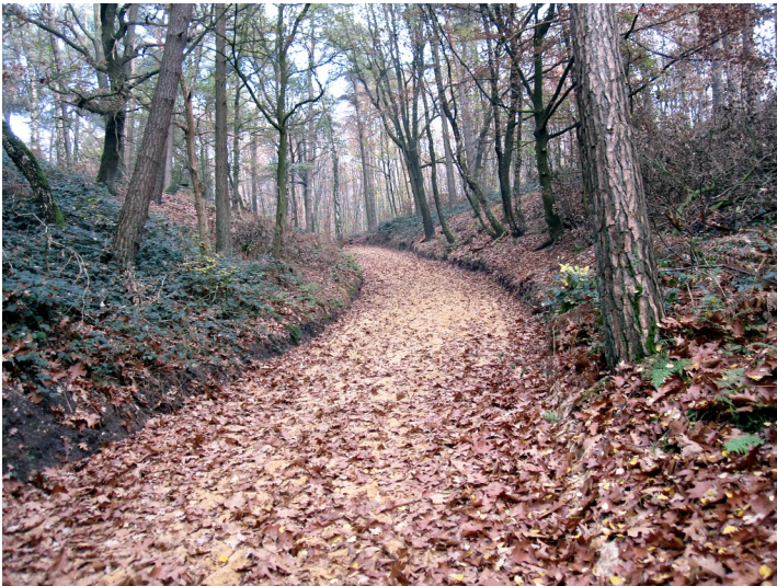
Verlauf der ehemaligen Trasse der Waldbahn Pfalzdorf im westlichen Steckenabschnitt im Reichswald (2011)