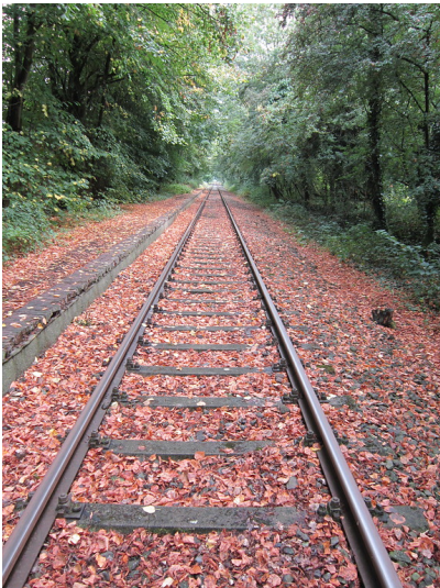
Bahnsteigkante des ehemaligen Haltepunktes Donsbrüggen, von Westen gesehen (2013)