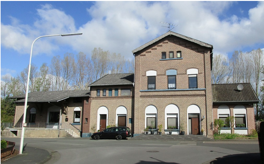
Empfangsgebäude Bahnhof Issum, südliche Ansicht, Straßenseite (2016).