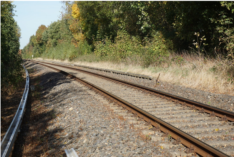
Turmbahnhof Menzelen-West, Bahnsteig der Bahnstrecke Rheinhausen - Xanten, Bahnsteigkante (2018)