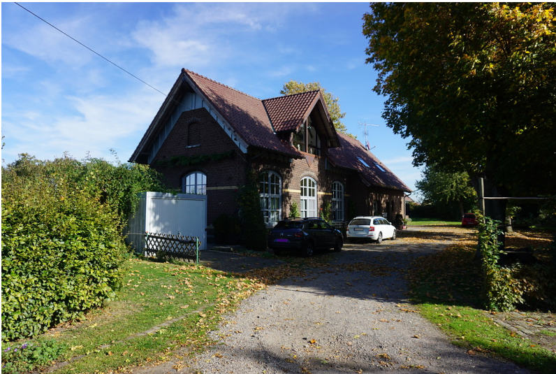
Bahnhof Menzelen-Ginderich der Boxteler Bahn, Empfangsgebäude, Straßenseite (2018)