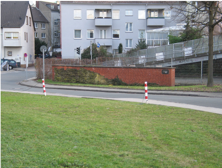
Abschnitt der Stadtmauer in Essen-Steele (2011)