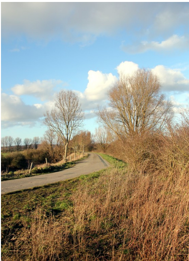
Bewachsener Eisenbahndamm der ehemaligen Trajektbahn Kleve-Zevenaar neben der Straße bei Kleve (2016)