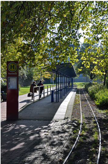
Haltestelle der Essener Grugabahn am Messegelände (2011).