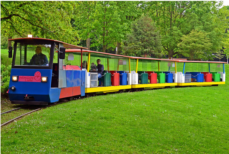
Der Zug "Heimliche Liebe" der zur Bundesgartenschau 1965 eingerichteten Parkbahn im Essener Grugapark (2013).