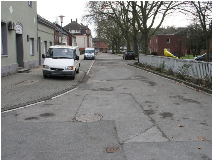
Straße Meybuschhof, ursprüngliche Trasse der Straßenbahn von Katernberg zur Herrmannstraße (2011)