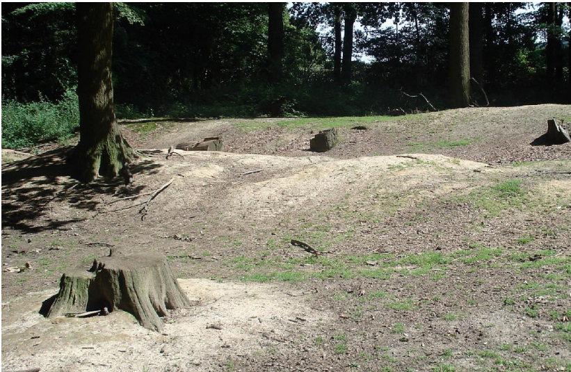
Grube am Bellenweg / Forstwaldstraße in Forstwald