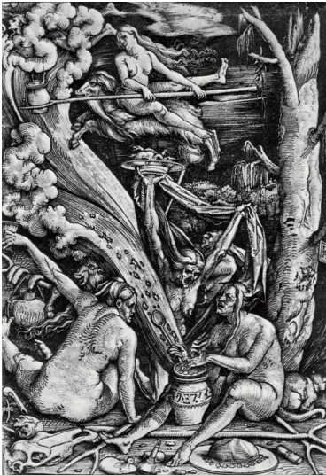
"Hexensabbat" mit Zubereitung eines Hexenmahls und Flug auf dem Bock, Holzschnitt von Hans Baldung Grien (1510). Fotograf/Urheber: Hans Baldung Grien