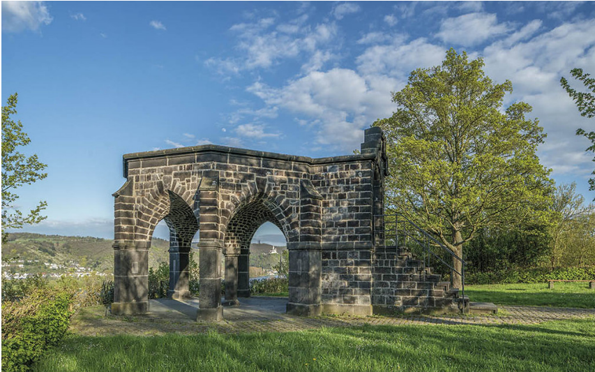
Königsstuhl in Rhens (2018)