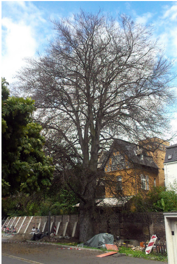
Die alte Blutbuche auf dem Parkplatz des Finanzamtes in Bonn-Weststadt im August 2014.

Schlagwörter: Solitärbaum , Rotbuche Fachsicht(en): Kulturlandschaftspflege Gemeinde(n): Bonn Kreis(e): Bonn Bundesland: Nordrhein-Westfalen