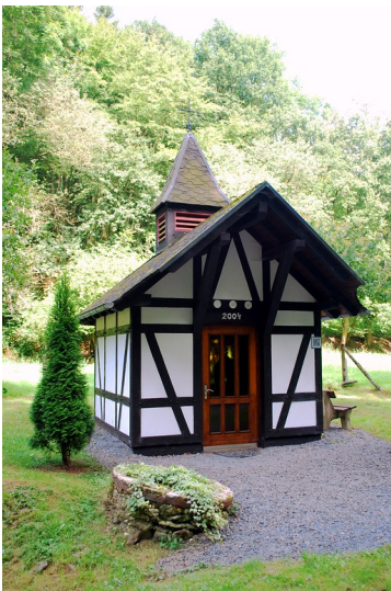
Gedenkkapelle der Fleschmühle bei Niederbreitbach (2014)