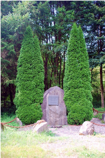
Ehrenmal für den 1945 gefallenen Oberfeldwebel Friedrich Bruchlos bei Niederbreitbach (2014)