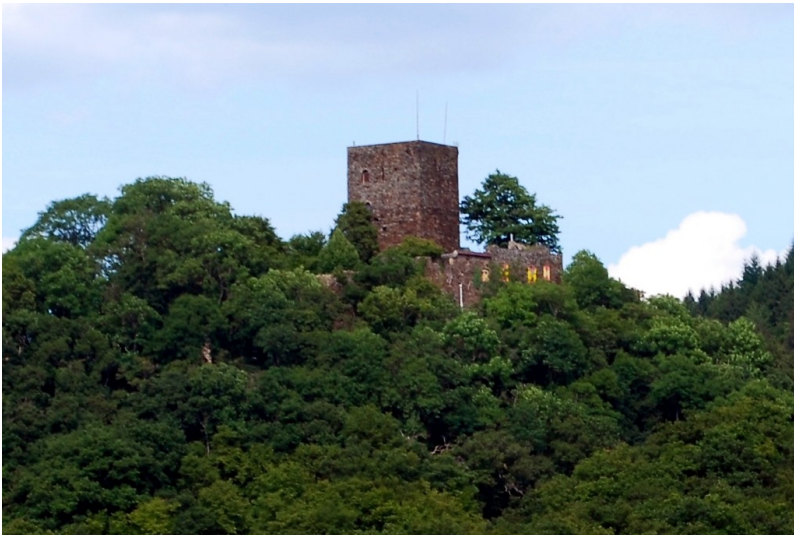
Teilansicht der Burgruine Neuerburg bei Niederbreitbach (2014)