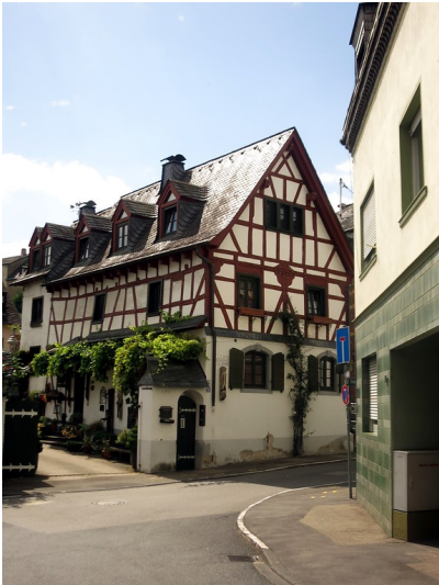
Fachwerkhaus in der Trierer Straße in Koblenz-Metternich, ein ehemaliges Gasthaus mit Posthalterei (2014).