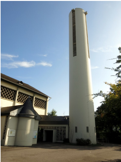
Der 34 Meter hohe runde Turm neben der Pfarrkirche St. Konrad in Koblenz-Metternich (2014). Dieser wurde in der Art eines Campanile freistehend und unabhängig vor der Kirche errichtet.