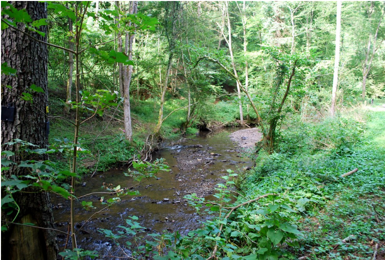
Blick in das Fockenbachtal bei Niederbreitbach mit dem Fockenbach und bachbegleitenden Gehölzen (2014)