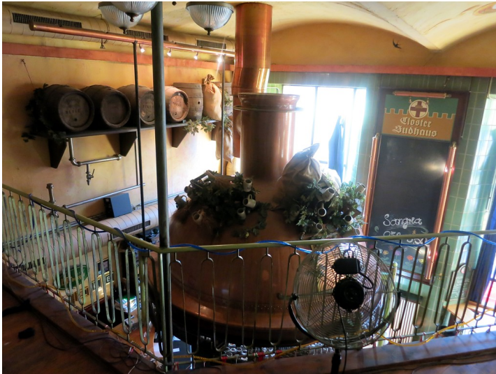
Gasthaus Closter Sudhaus in Koblenz-Metternich, Blick auf einen Braukessel (2014).