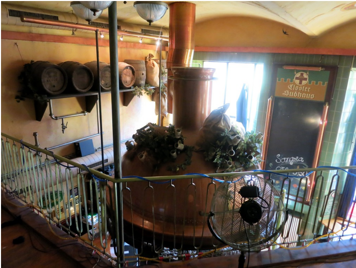
Gasthaus Closter Sudhaus in Koblenz-Metternich, Blick auf einen Braukessel (2014).