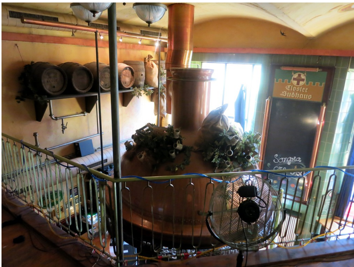
Gasthaus Closter Sudhaus in Koblenz-Metternich, Blick auf einen Braukessel (2014).