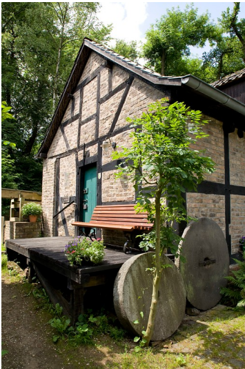
Holzlarer Mühle