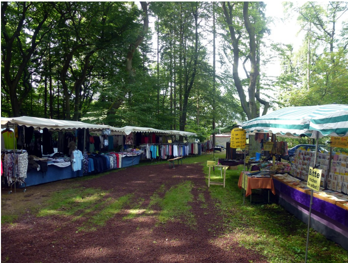
Verkaufsstände auf dem Augustmarkt im Herscheider Wald in Herscheid im Hunsrück (2014)