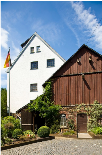
Mittelirser Mühle