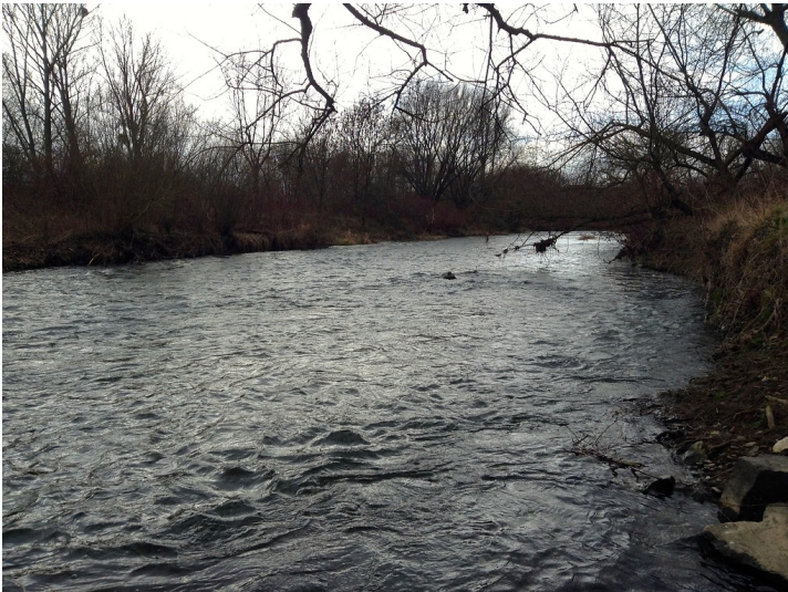
Ort der ehemaligen Furt durch die Ahr bei Sinzig (2014). Die Furt markiert den Übergang der Römerstraße zwischen Koblenz und Bonn über die Ahr.