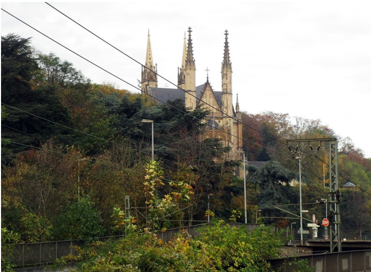
Blick von Südosten her über Gleisanlagen der Bahnstrecke Köln-Bonn-Koblenz und die Bundesstraße B 9 auf die Apollinariskirche in Remagen (2020).