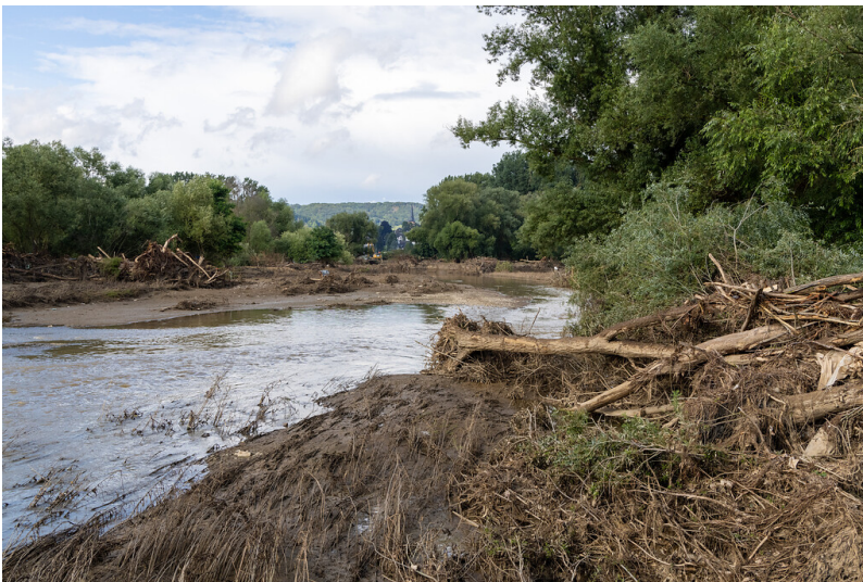
Mündungsgebiet der Ahr bei Sinzig (2021)