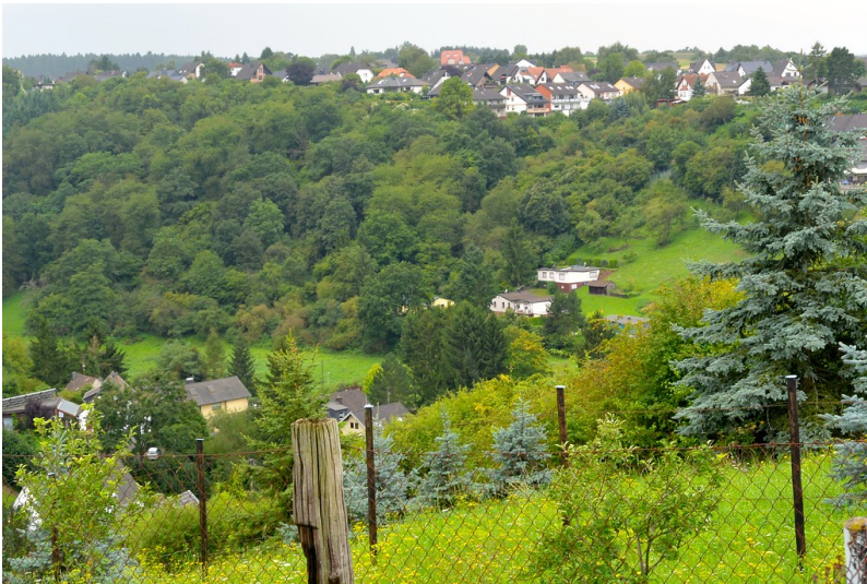
Blick vom Wadenberg Richtung Harbacherstraße Sinzig (2014). Der heute verbuschte und teilweise bewaldete Hang war zu Beginn des 19. Jahrhunderts weinbaulich genutzt.