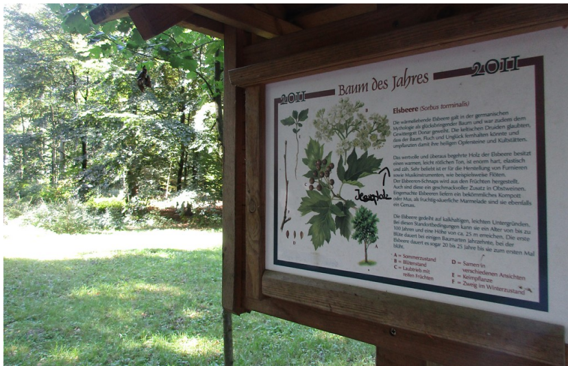
Hinweistafel zur Elsbeere, dem "Baum des Jahres 2011" am Baumlehrpfad im Duisburger Stadtwald (2016).