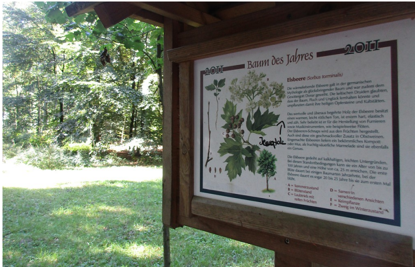
Hinweistafel zur Elsbeere, dem "Baum des Jahres 2011" am Baumlehrpfad im Duisburger Stadtwald (2016).