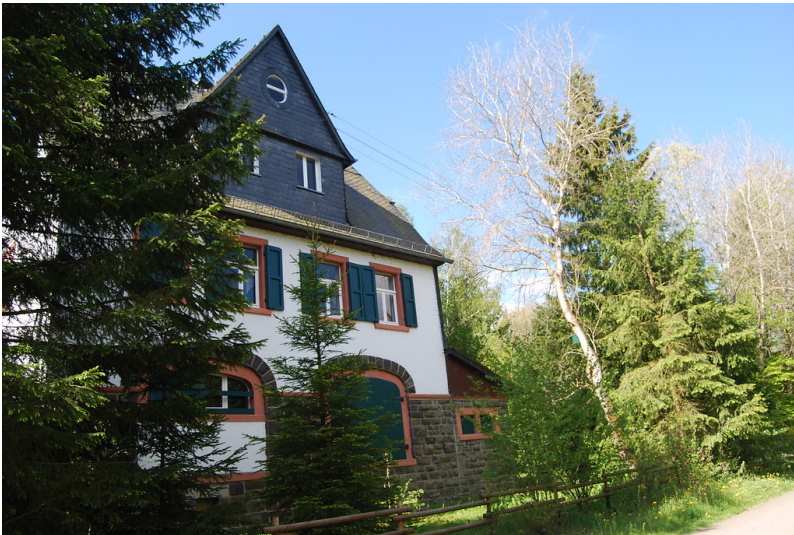
Empfangsgebäude des Bahnhofs Kronenburg in Dahlem (2014)