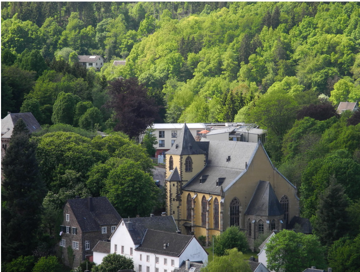
Schlosskirche in Schleiden (2014)