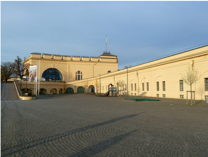
Festung Ehrenbreitstein, Niederer Schlosshof (2017)