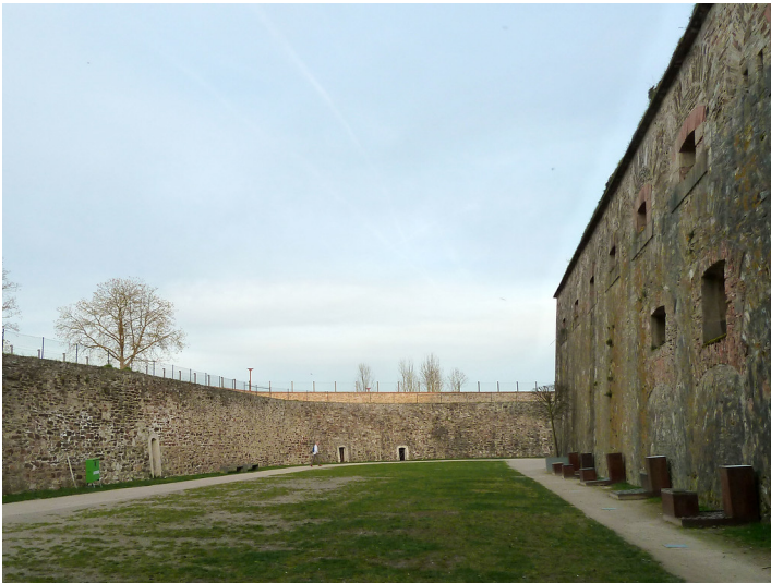
Festung Ehrenbreitstein, Hauptwall und Revelin (2017)