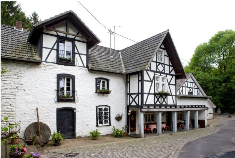
Reichensteiner Mühle