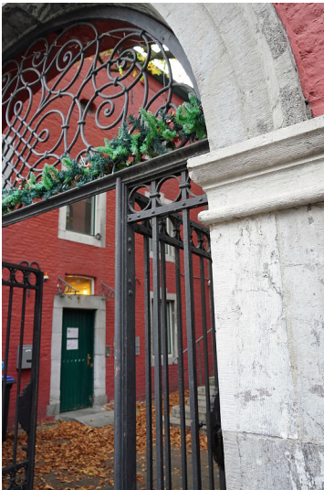
Torbogen des "Roten Hauses" bzw. "Alexander von Humboldt Hauses" im Stadtbezirk Aachen-Mitte (2021).