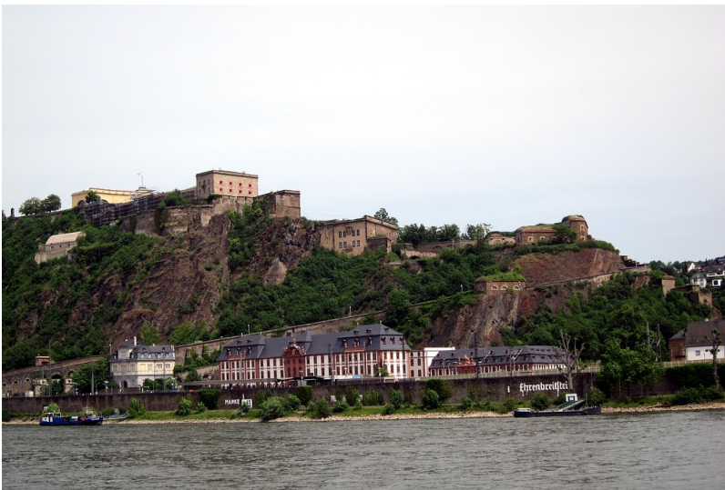
Blick auf die Festung Ehrenbreitstein von der Koblenzer Rhein-Uferpromenade aus gesehen (2014)